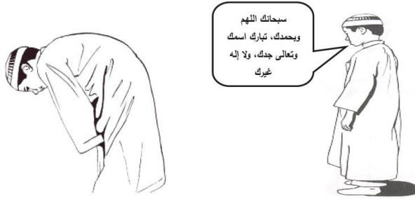
الصورة (٢) : ( ركن )

١١١ - صنف الصورتين التاليتين إلى " ركن - سنة " باعتبارهما من أعمال الصلاة .