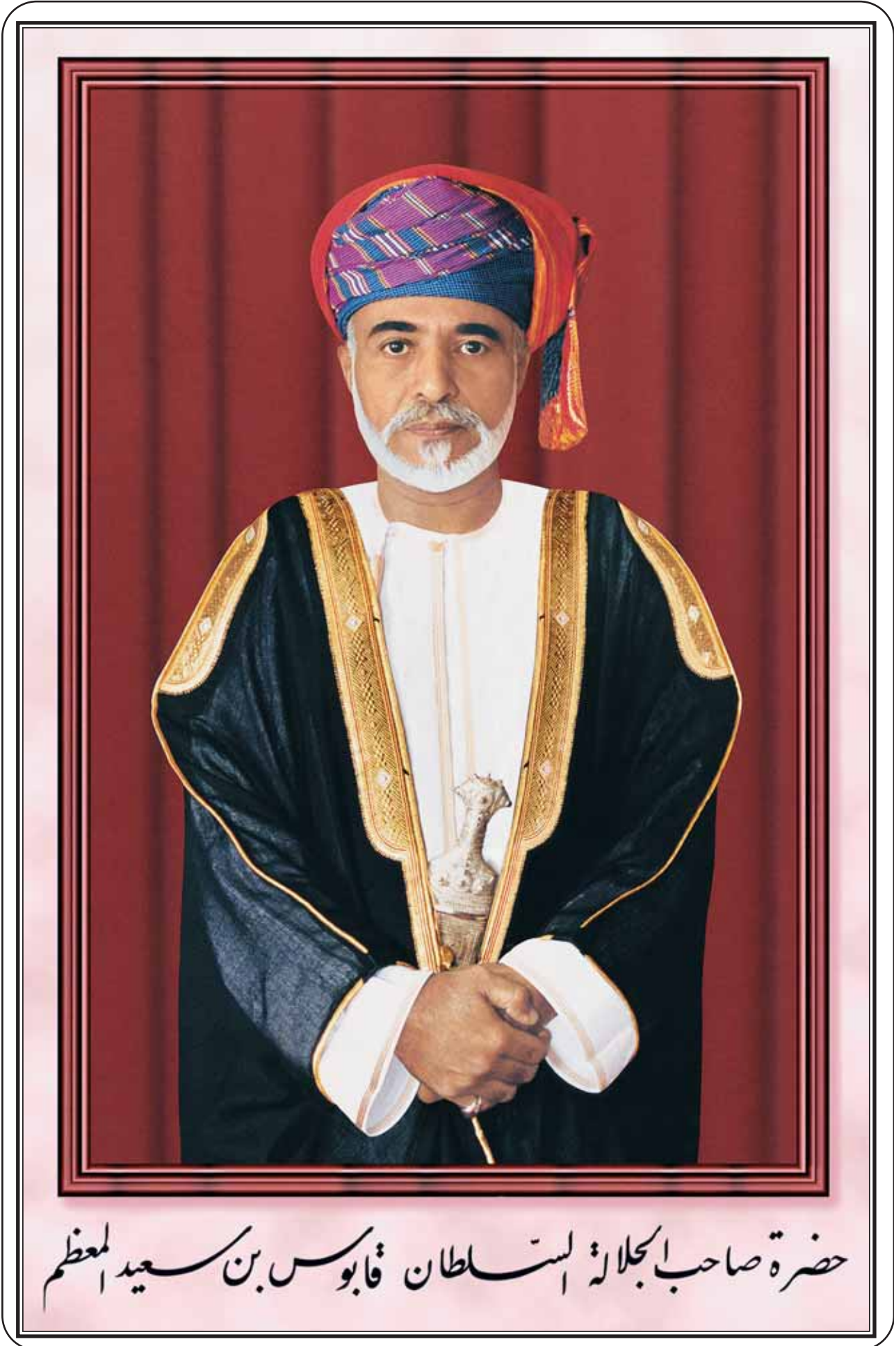
حضرة صاحب الجلالة السلطان قابوس بن سعيد المعظم